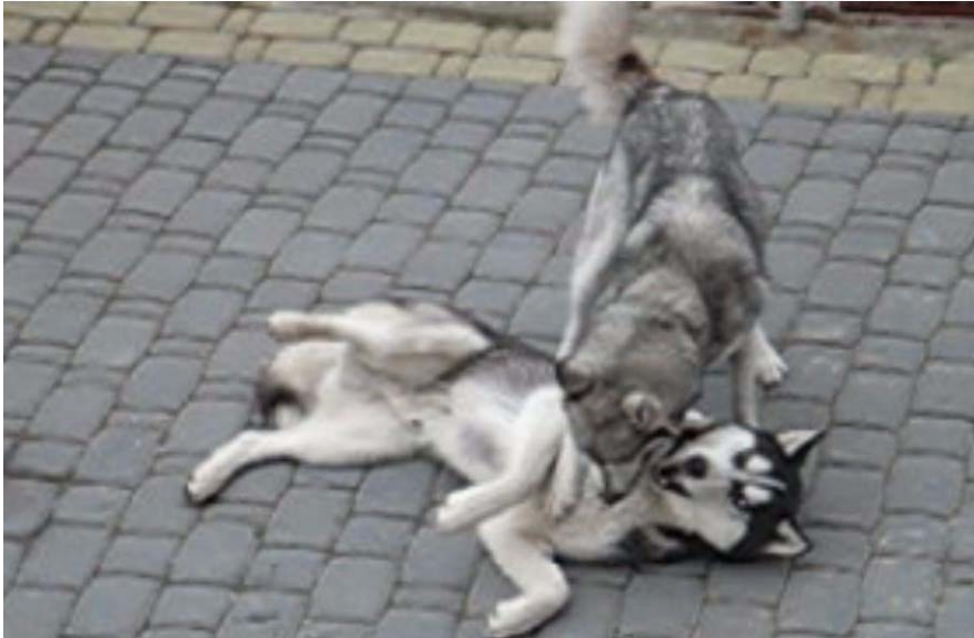
Zdjęcie 1. Pies bawi się, a nie walczy - zabawa psów, udawana walka; środkowa faza zabawy (zdjęcie z nagrań video, badania na temat interakcji zwierząt i ludzi, Konecki, 2008).

obrazie, bez etnograficznej wiedzy na temat kontekstu, jest niezwykle trudne. Obraz jest stały i zaobserwować możemy jedynie jeden etap danego wydarzenia bądź wydarzenie, które jest niezwykle trudne do zrozumienia w kontekście tego, jakie stadium wskazuje albo, jakiego typu zachowanie jest przez nas obserwowane (zobacz Zdjęcie 1 poniżej: Pies bawi się, a nie walczy ).