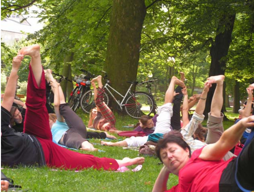
Zdjęcie 13. Joga w parku . Grupa praktykująca jogę – anantasana (projekt badawczy na temat jogi, Łódź, 2008).

uwagę temporalny wymiar jednostki te nie są ustrukturalizowane, ale mają raczej charakter procesualny. Zmieniają się cały czas, pod wpływem działań i interakcji. Kody „jednostek” połączone są z grupami społecznymi takim jak: naród, klasa społeczna, kasta, społeczność, organizacja, firma, przytułek, wydział, miasto, wieś, itp. lub z pozycjami społecznymi takimi jak: status, rola, przyjmowanie/odgrywanie roli, stopień, itp.