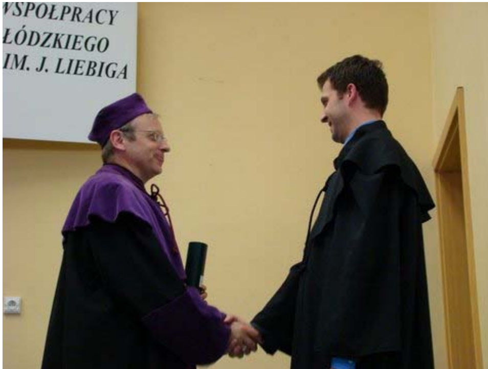
Zdjęcie 11. Podczas promocji – punkt zwrotny; zmiana statusu, mobilność społeczna.