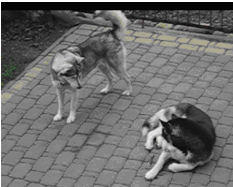
Zdjęcie 2. Przygotowanie do zabawy , początek sekwencji (zdjęcie z nagrań video, badania na temat interakcji zwierząt i ludzi, Konecki 2008).

Możemy zatem zidentyfikować dane stadia jeżeli tylko posiadamy sekwencję analizowanych obrazów bądź nagrania video (zobacz Zdjęcie 2 poniżej). Jeśli widzimy jakies znaki zabawy na początku interakcji (Zdjęcie 2), możemy wnioskować, co będzie się działo dalej w przypadku tej samej interakcji (Zdjęcie 1). Rozumienie sytuacji wywodzi się zatem z sekwencji tego zdjęcia, gdzie znaczenie generujemy w oparciu o obserwację rozwoju procesu krok po kroku.