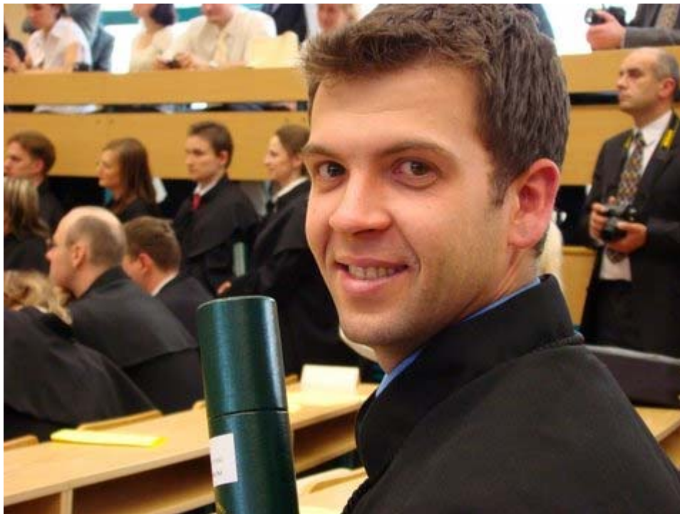
Zdjęcie 12. Po promocji – uśmiechanie się, szczęśliwa twarz, szczęście (z kolekcji fotografii Piotra Chomczyńskiego).

10/ Pewną logiczną kontynuacją wcześniej przedstawionej rodziny jest Rodzina , tzw., „jednostek społecznych” ( unit family , Glaser, 79-80). Pomimo faktu, iż terminy tej rodziny sprawiają wrażenie bycia pewnymi strukturalnymi etykietkami, z założenia nie są one jednak strukturalne. „Jednostki społeczne” jako grupy są częścią pewnego zjawiska, poddawane zmianom oraz procesom. Biorąc pod