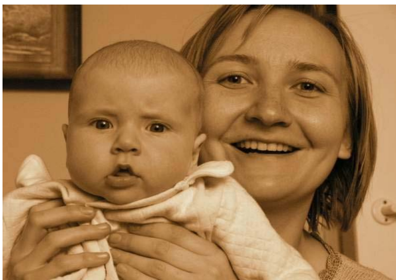
Zdjęcie 4. Macierzyństwo (dodatkowo można użyć tutaj terminów z „rodziny emocji” – duma, radość).

5/ Rodzina symboli połączona jest z interpretacją pewnych znaków przedstawionych na zdjęciu, które odnoszą się do szerszych znaczeń oraz innych obiektów i znaczeń, niż te, które są przedstawione na danym obrazie. Symbole pozwalają interpretować daną scenę, jak np. krzyż katolicki znajdujący się na biurku przedsiębiorcy w jego gabinecie pokazuje, iż wyznawane przez niego wartości nie są związane tylko z biznesem, ale mają one również wymiar transcendentny (zobacz Zdjęcie 5). Szczególnie widoczne się staje to w porównaniu z innymi fotografiami przedstawiającymi miejsca pracy przedsiębiorców. Analiza porównawcza jest zatem niezbędna by zauważyć pewne zjawiska i móc je skonceptualizować.