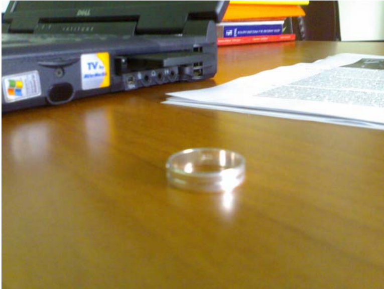
Zdjęcie 7. Znaczenie obrączki ślubnej leżącej na biurku, rodzina a praca. By stwierdzić, co jest bardziej istotne, ważna jest znajomość kontekstu, a także porównanie sekwencji fotografii pokazującej inne artefakty i symbole, które towarzyszą jego życiu

6/ „Rodzina świata społecznego/subkultury” połączona jest z mezo- i makro-poziomem analizy socjologicznej. Na zdjęciach możemy zaobserwować symbole wcześniej wykorzystywane do opisu rodzin kodowania (rodzina symboli). Te kody najczęściej odnoszą się do szerszych kategorii społecznych, pewnych „zbiorowości”, które połączone są raczej symbolicznie i ideologicznie bądź poprzez wspólne interesy, a niekoniecznie poprzez przestrzenne/fizyczne bądź społeczne granice. Zbiorowości te mają podobną perspektywę w postrzeganiu świata, która to perspektywa jest zasadniczym elementem łączenia różnych rzeczy w danym w świecie. Kodami pomocnymi w analizie tej rodziny są: światy społeczne, subświaty, światy życia, areny, spory, działania, żargon, gwara, kanały komunikacji, komunikacja, wartości, normy, rytuały, zrytualizowanie, legitymizacja, teoretyzowanie, subkultura, segmentacja światów, perspektywa, dyskurs, sposoby autoprezentacji, itp. (zob. fotografie w książce opisującej społeczny świat właścicieli zwierząt domowych, Konecki, 2005: 137-159).