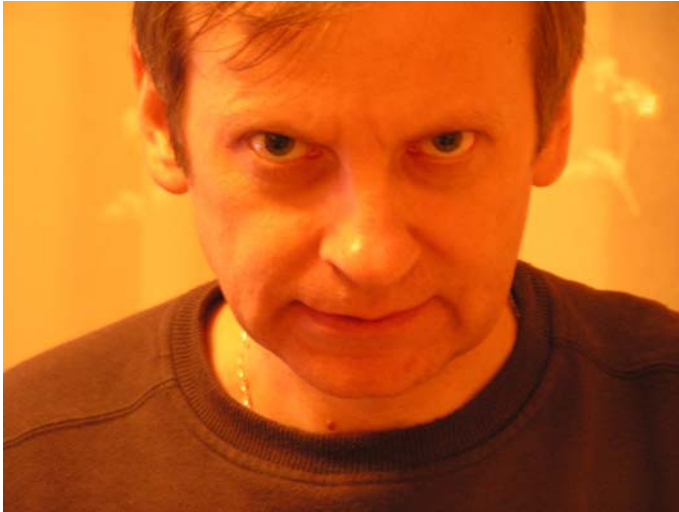
Zdjęcie 8. Emocje – „jestem na ciebie zły”, marszczenie brwi. Złość powstaje często w interakcji i z tego względu jest emocją społecznie wygenerowaną.

Wyrażanie emocji może być wskaźnikiem emocjonalnej więzi osoby przedstawionej na zdjęciu. Jakkolwiek potrzebujemy tutaj etnograficznego kontekstu, aby w pełni poznać i poprawnie zinterpretować daną emocję. Pokazywanie emocji może być przecież fabrykowane lub przedstawiane w specyficzny sposób przez daną osobę w danych kontekstach. Ważny jest także kontekst społeczny wyrażania i przedstawiania emocji. Kody emocji mogą odnosić się do opracowanych socjologicznie pojęć dotyczących emocji społecznych: odczucie upokorzenia ( mortification , Cooley, 1922), zakłopotanie ( embarrassment , Goffman, 1967/2006), wstyd oraz duma ( shame and pride , Cooley, 1922; Scheff, 1990). Kody emocji mogą być zatem ujmowane przy pomocy społecznie uwikłanych emocji takich jak: poniżenie, upodlenie, umartwienie, wstyd (twarz wstydzająca się), zakłopotanie, duma (dumna twarz) lub za pomocą innych emocji, które stanowią część więzi, relacji międzyludzkich, takich jak: szczęście, bycie zakochanym, smucenie się, żal, strach, nienawiść, czczenie kogoś, zazdrość. Mogą być one rozpoznane przez manifestacje takich gestów jak: płacz, trzęsienie się, uśmiechanie się, robieni min, marszczenie brwi, itp.